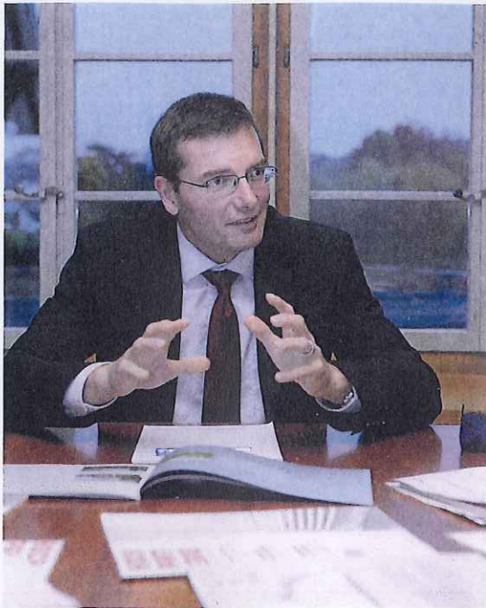
Stadtpräsident Raphael Lanz: «Ein Investor sollte kein Interesse daran haben, etwas zu bauen, das städtebaulich nicht überzeugt.»